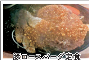
豚ロースバーグ定食