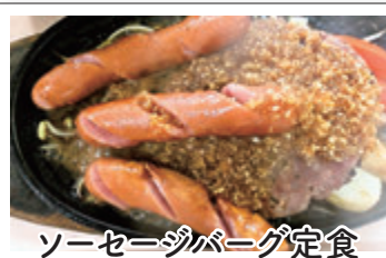
ソーセージバーグ定食