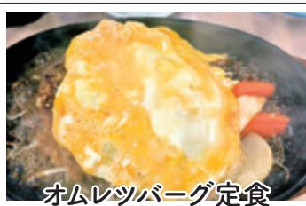
オムレツバーグ定食