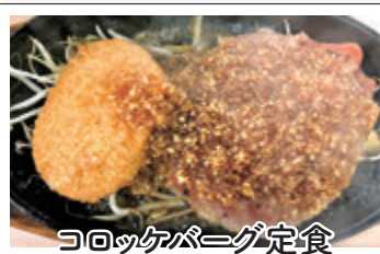
コロッケバーグ定食