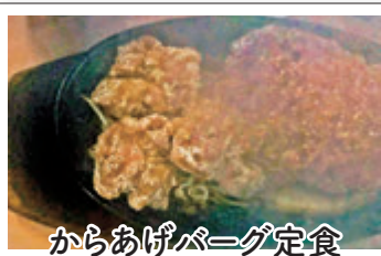
からあげバーグ定食