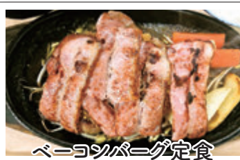
ベーコンバーグ定食