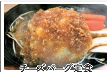
チーズバーグ定食