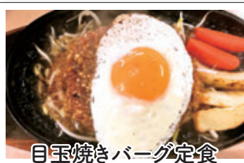
目玉焼きバーグ定食